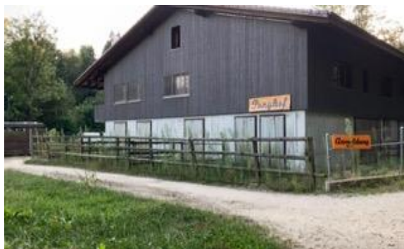
Ponyhof in Reinach BL