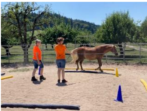
TDA™ Quadrat-Longe mit Patient

Wir bilden interessierte Personen zu TDA™-Therapeut*innen aus. Die Ausbildung dauert zwölf Monate.